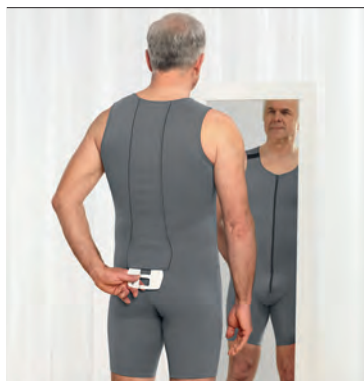
Spinomed active men

Spinomed active svart finns även i champagne