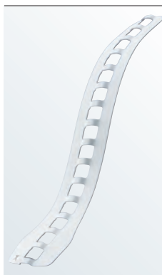
Ryggsskenan till Spinomed active kan enkelt avlägsnas

känna dig tryggare och säkrare för varje dag.