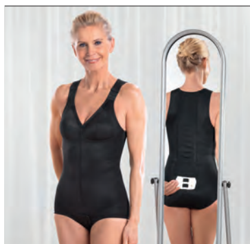
Spinomed active black

Spinomed active svart finns även i champagne