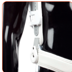
▲ Enkel och säker låsme- kanism.