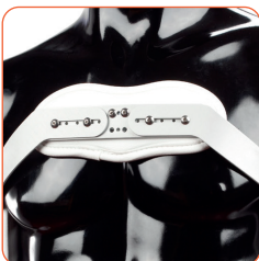
▲ Justerbar i sidled.