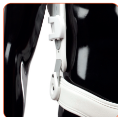
▲ Enkel och säker låsme-kanism.